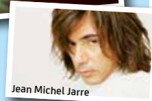
Jean Michel Jarre