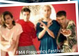
FM4 Frequency Festival